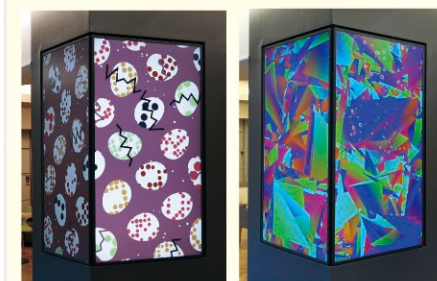
C棟1階クロスラウンジ柱周り 作品名 デイリー・コース [365++]