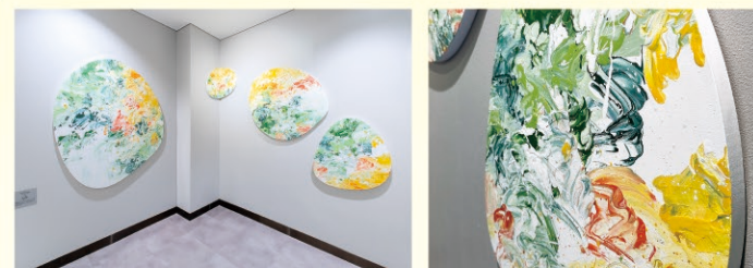
C棟2階廊下 作品名 ナツミカンの木

入院病棟や診療施設が整備されると共に、各所にはホスピタルアートが展示され、患者さんのための心安らぐ空間づくりが始まっています。