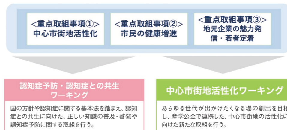
【うべ・未来共創プラットフォームの取組事項】

共生」及び「中心市街地の活性化」を推進するワーキングを設置しました。認知症予防・認知症との共生については、認知症に関する正しい知識を幅広い層へ知ってもらう為、市民に向けた啓発活動や認知症サポーター養成講座の充実等の検討を始めています。中心市街地活性化については、市内大学生に対してアンケートを実施し、中心市街地への訪問頻度や期待、課題について現状分析を行いました。現在、具体的な取り組みについて議論を進めています。