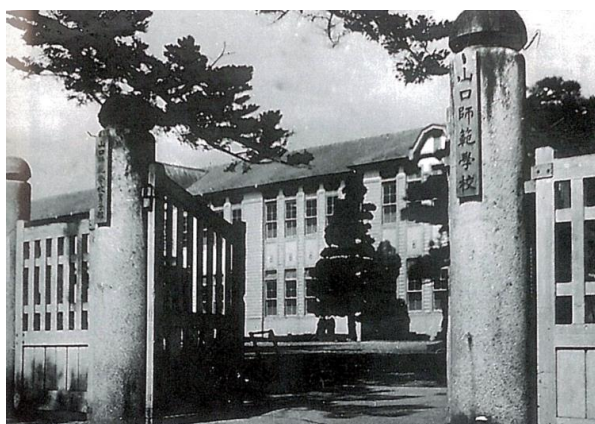
山口師範学校(男子部)(昭和23年頃)

戦後間もなくGHQの指令により教職の適格審査が行われる一方、昭和21(1946)年4月の「第一次米国教育施設団報告書」では、4年制課程の大学段階の教員養成が勧告されている。同年8月に設けられた教育刷新委員会は、2度の建議において教員養成を大学で行うこと、小・中学校の教員を養成するために学芸大学・学部を設置することを主張した。昭和23年6月、文部省は新制国立大学の設置に関して「十一原則」を発表し、その中で一府県一大学の実現を図ること、各都道府県には必ず教職に関する学部を置くことが示された。新学制による新制大学の発足により、山口師範学校は明治7(1874)年4月の教員養成所の創立以来77年間の歴史が閉じられた。