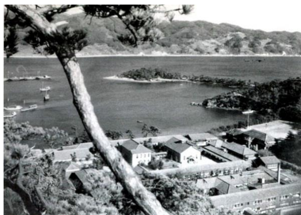
山口師範学校(女子部)(昭和23年頃)