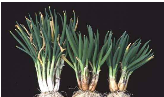
図2 ネギ（左）にシャロット第5染色体を添加した系統（真ん中、右）