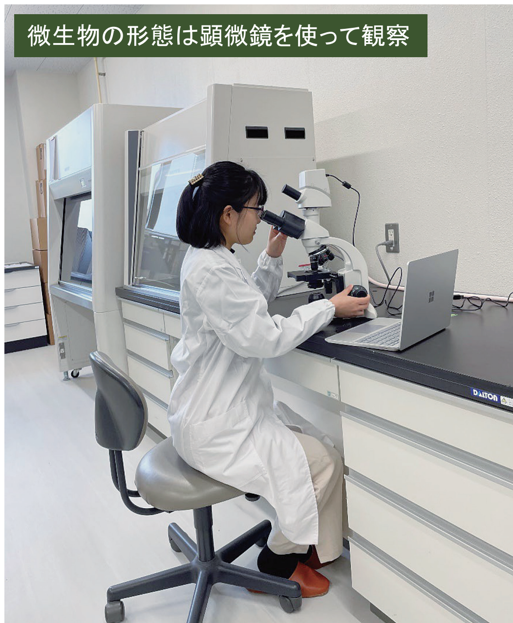
微生物の形態は顕微鏡を使って観察